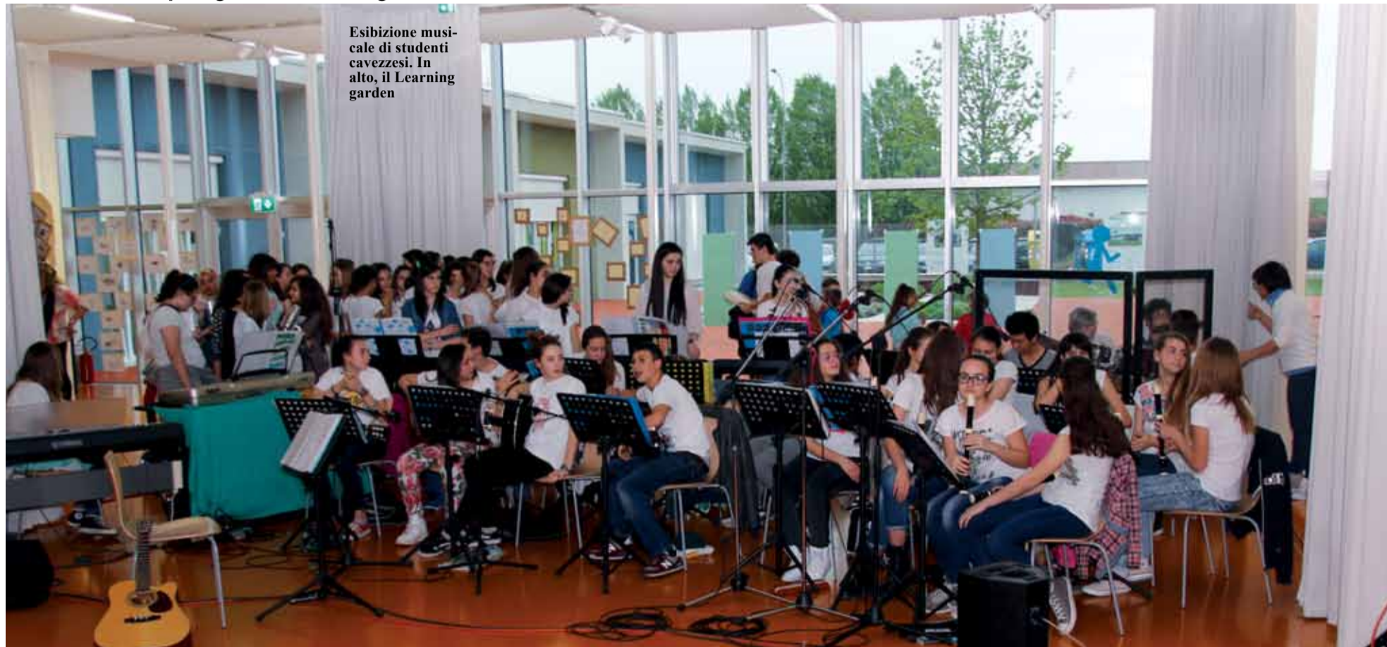
Esibizione musicale di studenti cavezzesi. In alto, il Learning garden

Sono diversi i progetti per il miglioramento dell'offerta formativa, per i quali è stato mantenuto il livello del contributo e della collaborazione dello scorso anno, nei tre ordini scolastici (infanzia, primaria, medie). Le iniziative sono: la danza educativa (5 sezione infanzia), il teatro in lingua inglese (primaria, classe 4°), madrelingua inglese (primaria, classe 5°), piccoli scienziati (primaria, 3°, 4°, 5° tempo pieno, 8 classi), Giorno della Memoria (secondaria, 2° e 3°), musica d'insieme (secondaria, 2° e 3°), natural english for teens (secondaria, 3°). In collaborazione con il territorio e con gli assessorati Sport, Cultura, Ambiente, i progetti messi in campo sono: la palla nello zaino, lettura/biblioteca, educazione ambientale, la scelta, educazione stradale polizia municipale, allestimento dell'orto per la scuola primaria. Da segnalare poi il progetto scuola/Protezione civile, realizzato dai volontari della Protezione civile di Cavezzo e rivolto alle classi della scuola primaria e della scuola media. L'iniziativa si propone di diffondere la cultura della solidarietà, l'impegno civile e