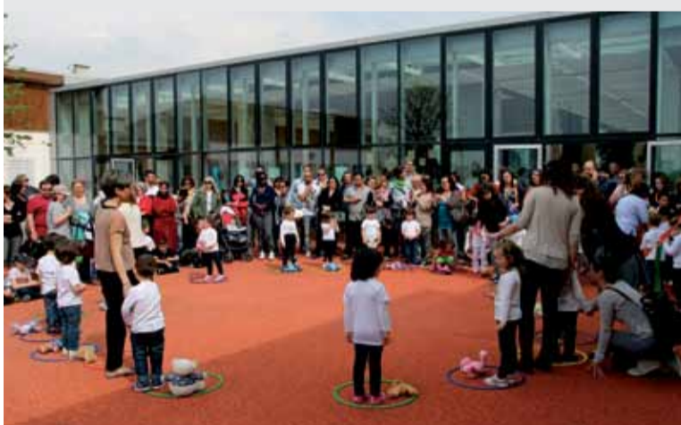
L'Amministrazione comunale è a fianco della scuola e dei genitori con interventi di sostegno alla di-

didattica e fornendo servizi a domanda individuale per le famiglie: nel presente anno scolastico gli interventi e