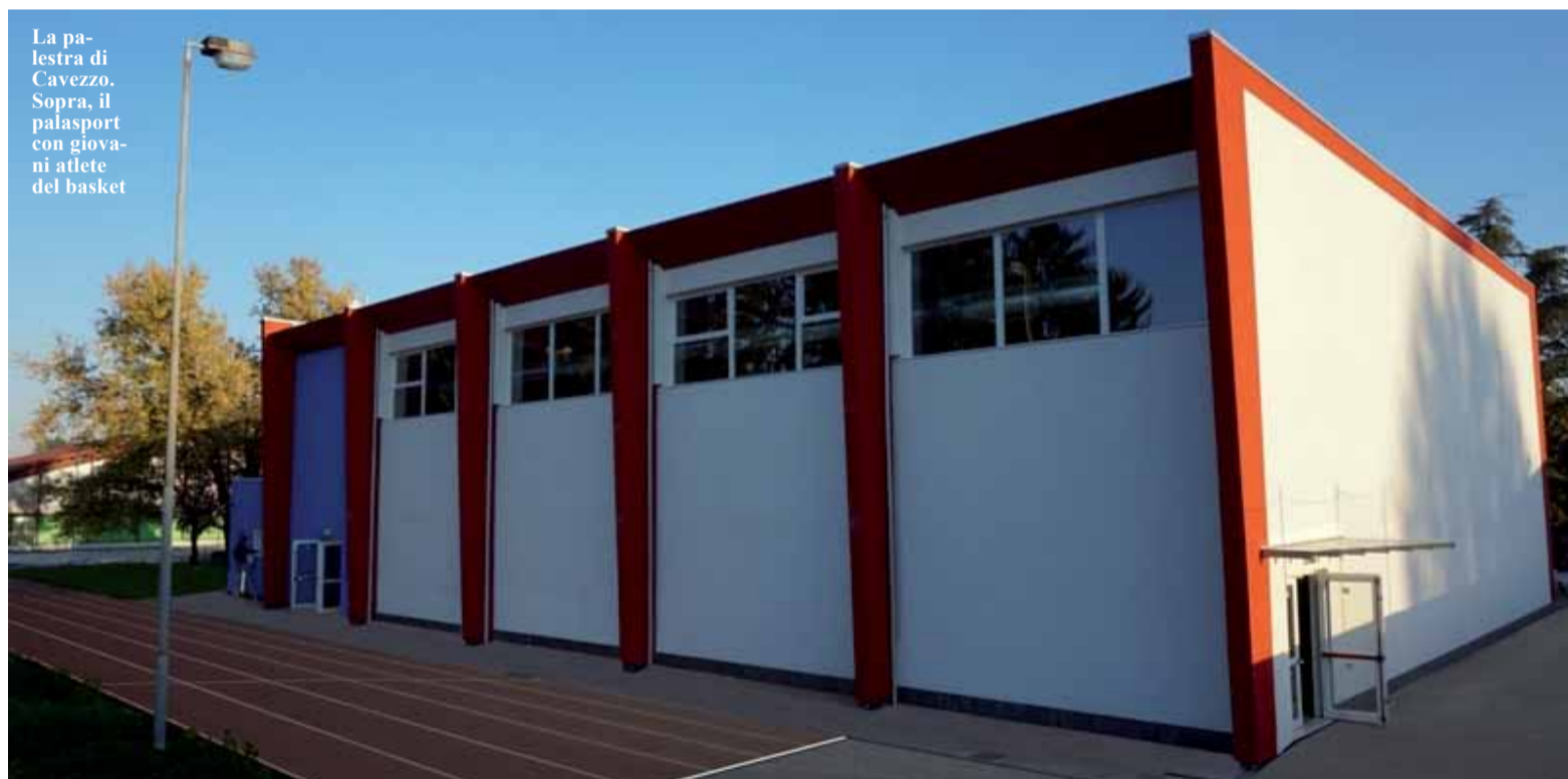
La palestra di Cavezzo. Sopra, il palasport con giovani atlete del basket

Si sono conclusi a Cavezzo i lavori di ripristino di tutti gli impianti sportivi e del polo scolastico, mentre per quanto riguarda la ricostruzione delle abitazioni private sono già stati riconosciuti oltre 86 milioni di euro di contributi Mude. La recente riapertura della palestra e